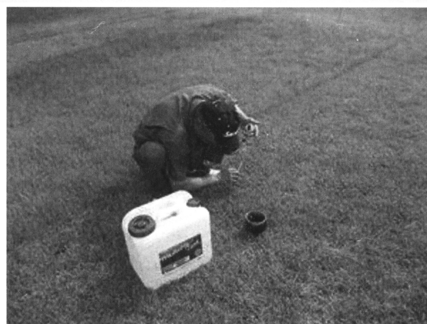
写真3. 簡易透水法による測定

サッチが分解されることで透水性が向上することから、現場簡易透水性調査を行った。その方法は、各試験区にホールカップを打ち込み、水を施して土壌を飽和状態にし、水が土壌に浸み込む深さを時間で測定した。(写真3) 調査開始時は試