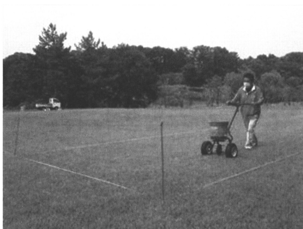
写真1. サイクロンによる施肥作業

管理：試験区はシバウラ製ロータリーモアGC53Aを用い7~10日間隔で刈り込みを行った。この刈込機械の特長には刈り取った芝草を集草できるため、刈りカスの取りこぼしが少ない利点がある。(写真2)